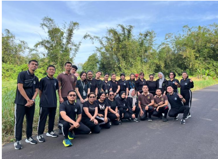
Penulis mengikuti jalan sehat dan senam bersama pegawai dan staf Kantor Kejaksaan Negeri Tomohon