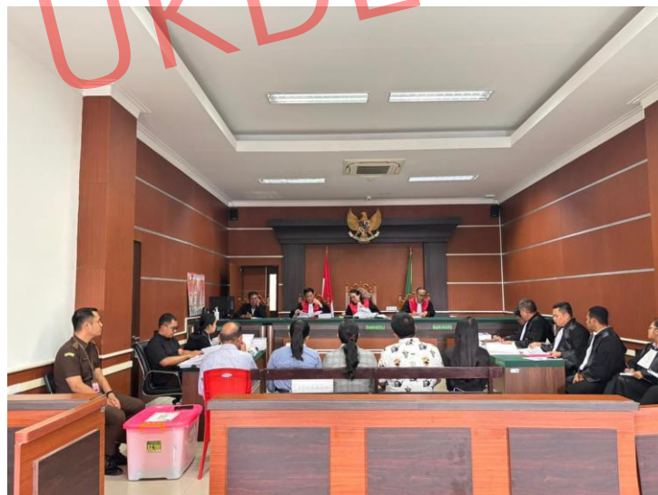
Penulis mengikuti sidang kasus korupsi di Pengadilan Negeri Manado