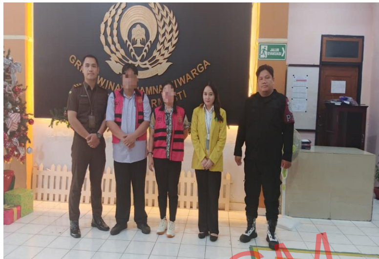
Penulis bersama pegawai kantor menjemput terdakwa di Rumah Tahanan Kelas II A Manado