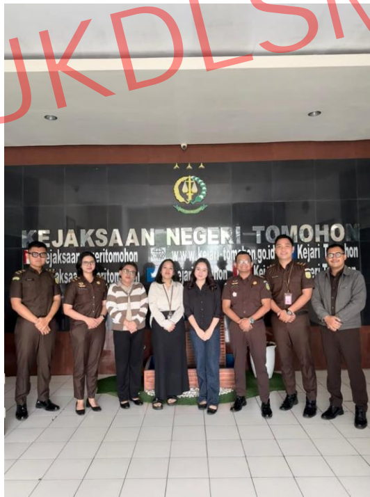
Foto bersama Seksi Tindak Pidana Khusus