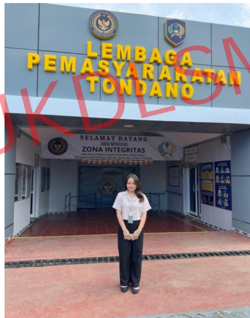
Penulis bersama pegawai menjemput tahanan di Lembaga Pemasyarakatan Tondano