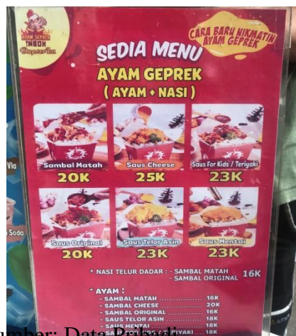
Gambar 2.1 Harga Ayam Geprek Inbox Dapoerku

Harga juga merupakan komponen yang mempengaruhi keunggulan bersaing. Dalam memilih makanan harga tentu menjadi bahan pertimbangan yang penting, namun harga makanan juga harus disesuaikan dengan kualitas karena mempengaruhi pandangan konsumen terhadap kualitas makanan tersebut. Maka dari itu agar dapat bersaing dengan usaha lainnya pelaku usaha biasanya menetapkan harga bersaing yang sesuai dengan kualitas namun tetap menguntungkan. Kotler (2019:67) menyatakan bahwa harga adalah bagian dari bauran pemasaran yang menghasilkan pendapatan, sedangkan komponen lain menghasilkan biaya. Dapat disimpulkan dari pengertian diatas, bahwa harga ialah sebuah penetapan transaksi jual beli barang atau yang telah disepakati bersama antara dua pihak atau nilai barang atau jasa yang ditawarkan penjual kepada pembeli.