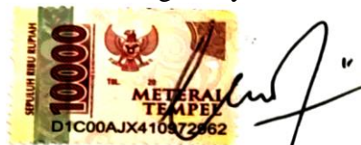
Ernesto Julio Simatupang