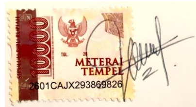
Inka Scully Mumu