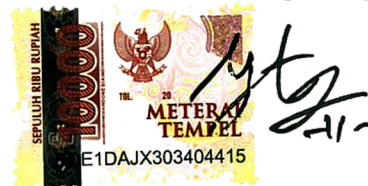
Yonatan Efraim Toembio