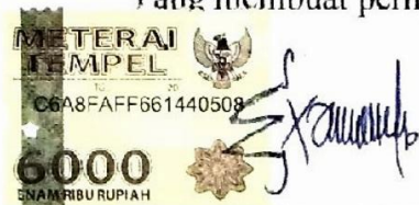
Exaudia Domini Bawole